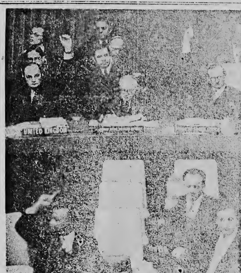
OOK DE ALGEMENE VERGADERING van de V.N. heeft de resolutie van India ter zake Korea goedgekeurd, met slechts de ledenstaten van het Sowjet blok als tegenstemmers.

Zes amendementen van de Russen op de resolutie werden verworpen. Volgens deze amendementen zou eerst besloten worden tot het staken van het vuur en pas daarna zou een besluit genomen worden over de krijgsgevangenen. Hierboven tijdens de stemming.